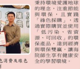
▲本校榮獲綠色消費及綠色採購績優廠商

綠色採購及綠色消費是永續發展所不可或缺之核心價值，本校新建工程所需之各項材料皆優先採購環保並具節能標章之產品，秉持環境愛護地球的理念，注重節能與環保，且實踐「綠色採購」，透過實際購買並使用「低污染、省資源、可回收」的環保產品，達到經濟與環保雙贏，讓海院師生享有健康安全的學習環境。