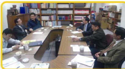
雙方愉快的洽談產學合作事宜

本校與臺北市消防局雙方並就未來資源共享及相互支援之目標，本校將協助消防局教導本校全體師生CPR、AED、EMT-1緊急救護技能外，並藉由該局訓練中心滅火訓練設施，加強本校師生防災滅火教育推廣，除可加強學員自救救人能力，更可擴展市民防災滅火正確概念之成效；本校未來除提供碼頭作為消防救援使用外並對本市消防弟兄提供動力小船駕駛訓練、水上摩托車救生訓練、IRB救生訓練、潛水搜救訓練並協助取得相關技能證照。