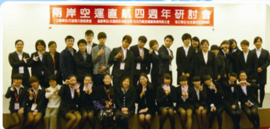
▲兩岸空運直航研討會後海空系工作夥伴開心合影

本校海空系於2012年12月12日及14日分別假松山機場第二航廈、交通部運輸研究所舉辦全國「兩岸空運直航研討會」、「兩岸海運直航研討會」。兩岸直航一系列研討會係由行政院大陸委員會委託，由本校海空物流行銷系承辦。