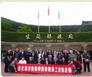
教職員工自強活動全體師長合影留念

情接待，並親自解說國立傳統藝術中心之設立與任務，力求台灣傳統藝術獲得完善保存，並傾力推動傳統藝術的維護與研究及推廣保存、傳習、展演及推廣等工作，為帶動民間藝術的再生、發展與創新，傳統藝術的保存維繫、關心與重視，永續保存民間生活藝術之美；國立傳統藝術中心園區之建築景觀傳統樸實，配合現代化之功能與視覺美感，具體化呈現早期庶民生活場景，並提供現代民眾接觸傳統藝術的機會，增加方便性。