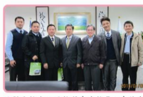
▲傑出校友回母校拜會唐校長，會後合影留念

唐校長建議自101學年下學期起即可由通識中心開設「名揚四海成功講座」供同學選修，由校友會每周邀請企業家校友返校，分享創業及就業服務等經驗，讓在校