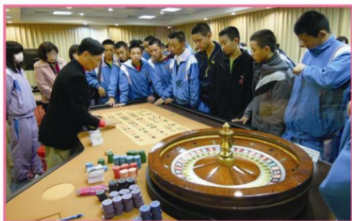
▲漳和國中師生蒞校參訪本校優質的教學環境

2013年1月25日海觀系師生接待漳和國中師生共三十七人蒞臨參訪，海觀系安排特色課程提供進行體驗之旅。海洋休閒觀光系之特色課程包括：博奕遊戲體驗、水族館參觀、獨木(平台)舟操作體驗、社子島地理與生態介紹。漳和國中師生對海觀系課程與擔任導覽介紹的五專同學們留下深刻的印象。