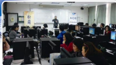
教職員工認真的學習 Excel 2010 實務應用

本校圖書中心於2012年8月與11月相繼辦理「微軟文書處理系統(Word 2010)與簡報製作(PowerPoint 2010)研習活動」後，特別於2013年1月24及25日舉辦Excel 2010實務研習營。